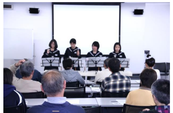
ハンドベルの演奏依頼♪お待ちしております！

第1部として、地域で学生が取り組むボランティアと福祉の活動について、3つの団体からご紹介いただきました。沼津市立長井崎中学校文化活動部はハンドベル演奏に取り組み、昨年度から市内の福祉施設への訪問を始めています。静岡県立沼津商業高等学校インターアクト部は、募金や献血の呼び掛け等、日頃から様々な活動を行っています。愛鷹地区社会福祉協議会には、星を観る会、認知症サポーター養成講座等の小中学生が参加する事業について、大人の目線からお話しいただきました。