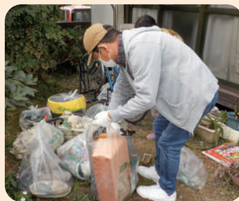
生活支援ボランティア (ちよいてつさん)