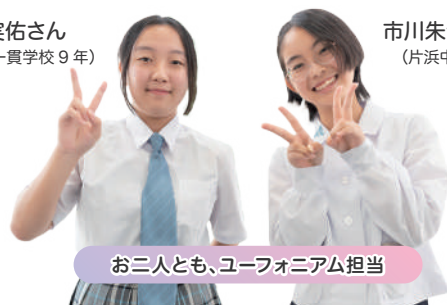
お二人とも、ユーフォニアム担当