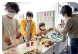
沼津市ボランティア連絡協議会