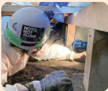
災害ボランティア

今までの経験を活かし興味がある活動に参加することで、家の外に出て人と関わりを持ち続けることが健康でいるための秘訣です。