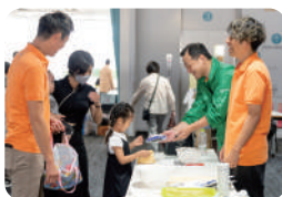
一般社団法人沼津青年会議所