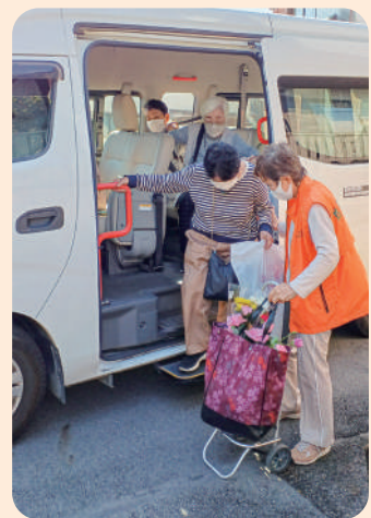
外出支援ボランティア

「くらしつなげ隊」は高齢者が外に出て社会と繋がりが持てるように様々なお手伝いをしたり、通いの場の提供等をしていきます!